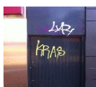
B Graffiti op PMMA panelen (Evonik)